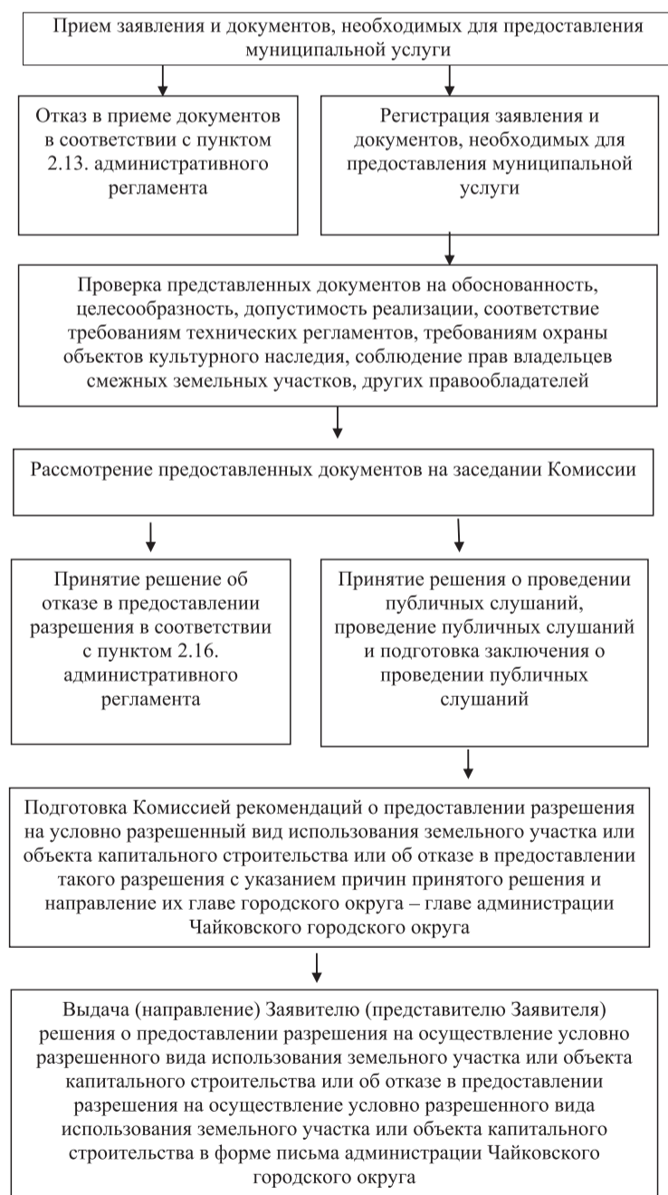
Блок-схема предоставления муниципальной услуги

Приложение 2 к административному регламенту предоставления муниципальной услуги «Предоставление разрешения на осуществление условно разрешенного вида использования земельного участка или объекта капитального строительства»